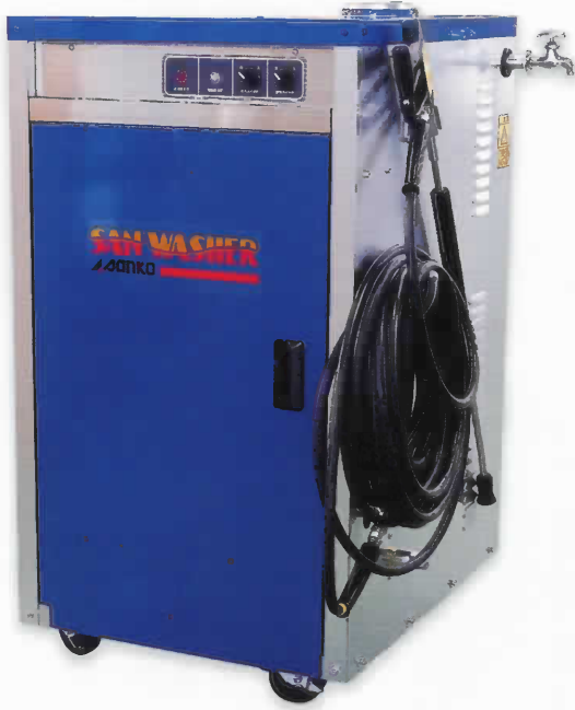
① ZW-1000T ② ZW-1200T